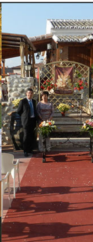
"ACTOS DE ANILLOS"