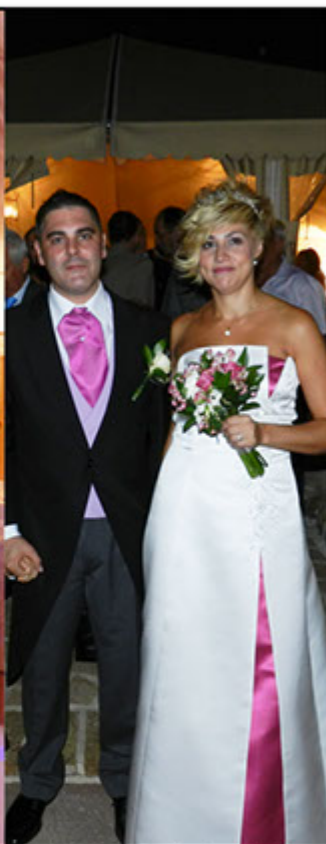
"BODAS AL AIRE LIBRE"